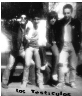
Primera formación de Los Testículos, 1978.